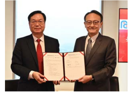
元智大學與遠東新世紀成立企業書院

為打造全球人才基地，遠東集團與元智大學於 2022 年起，推動「企業書院」及「國際書院」，以企業需求為課程規畫主軸，由企業業師與校內教師共同授課，不僅學校教學能有效銜接學生就業，企業也可獲得適才適用之優秀人才。為進一步擴大與強化各學院英語學士班，元智大學以國際書院之概念，整合各院英語學士班，增聘 10 名外籍優秀師資，大一至大四英語課程於國際書院開授，專業課程採全英語授課。各系所可以淨零永續和智慧應用等議題為主軸，設計創新的專業英語學程。同時，元智大學也與中強光電、欣銓科技簽訂產學合作意向書，分別成立光電書院及半導體書院，配合產業命題，提出研發專案，以符合產業發展及青年就業之所需。