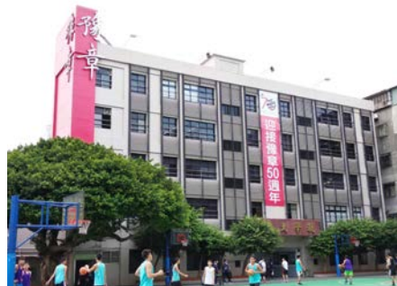
豫章工商持續培養學生多維度的競爭力

為打造全球人才基地，遠東集團與元智大學於 2022 年起，推動「企業書院」及「國際書院」，以企業需求為課程規畫主軸，由企業業師與校內教師共同授課，不僅學校教學能有效銜接學生就業，企業也可獲得適才適用之優秀人才。為進一步擴大與強化各學院英語學士班，元智大學以國際書院之概念，整合各院英語學士班，增聘 10 名外籍優秀師資，大一至大四英語課程於國際書院開授，專業課程採全英語授課。各系所可以淨零永續和智慧應用等議題為主軸，設計創新的專業英語學程。同時，元智大學也與中強光電、欣銓科技簽訂產學合作意向書，分別成立光電書院及半導體書院，配合產業命題，提出研發專案，以符合產業發展及青年就業之所需。