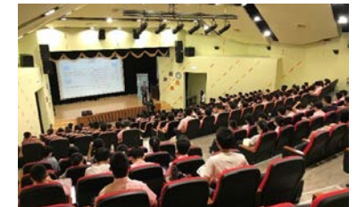
竹科實中場次現場實況