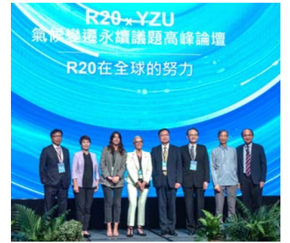
元智大學與 R20 氣候行動區域組織共同舉辦「氣候變遷永續議題高峰論壇」

論壇中另規劃「淨零轉型與淨零商機」與「ESG 與公民素養」兩項議題，前者著重在分享國內企業如何成功轉型，尤其針對零碳議題。後者則著重在鼓勵青年人重視與了解 ESG 為全球公民之義務，除了應與國際接軌，更須提升 ESG 公民素養。