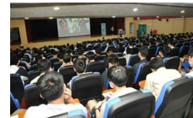
建國中學場次現場實況

2013 年起，徐有庠先生紀念基金會舉辦「有庠創新論壇」，鼓勵青年投入科技領域，為下個世代開創嶄新的未來。2022 年適逢慶祝基金會成立 20 週年，將有庠創新論壇的舉辦場次擴大為五場，分別前往台北市的建國中學、北一女中、師大附中與中山女中，以及新竹市的竹科實中，讓高中學生接觸更多元豐富的科技領域。論壇邀請「有庠科技獎」獲獎的優秀學者擔任演講者及與談人，透過成果分享及經驗傳承，啟發年輕學子勇於迎向新興科技產業。依據現場回收問卷統計結果，演講滿意度高。